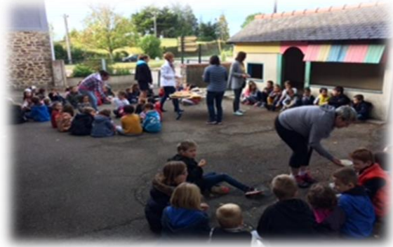
Goûter partagé durant la semaine du goût et découverte des saveurs de l'automne.