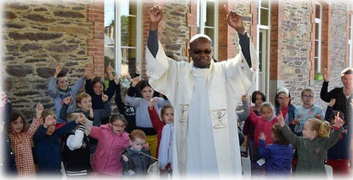
Bénédiction des enfants et des cartables.

Un début d'année scolaire ponctué de moments forts partagés par les 62 élèves de l'école.