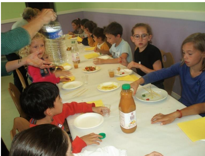
Mercredi 20 octobre : atelier culinaire sur le thème de l'Asie. Une quinzaine d'enfants a participé activement à l'ensemble de ces ateliers.