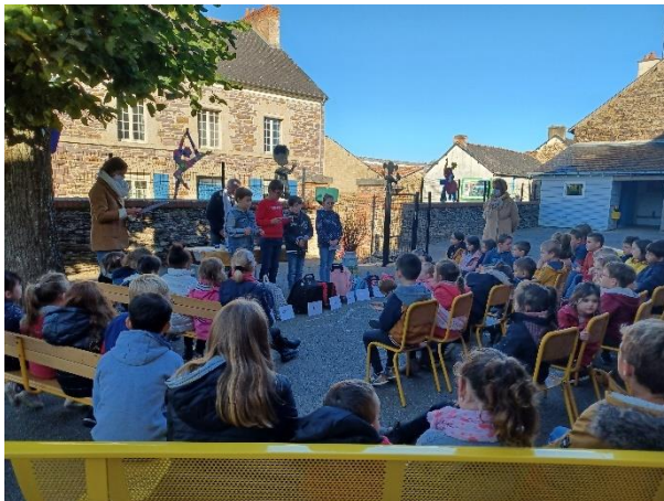
Les CE1 ont chanté avec énergie une chanson en anglais

Les CE2, CM1 et CM2 ont appris aux plus petits « A quoi ça sert, l'école ? ». Ça permet d'apprendre des choses, de faire des rencontres et de se débrouiller tout seul ! La journée s'est clôturée par une danse et un goûter d'automne : des fruits de saisons et des tartines de confiture de châtaignes, de coings et de figes. La plupart des élèves était volontaire pour goûter les saveurs variées ! Félicitations à tous les élèves. Un bel esprit d'ouverture culinaire et quel régal