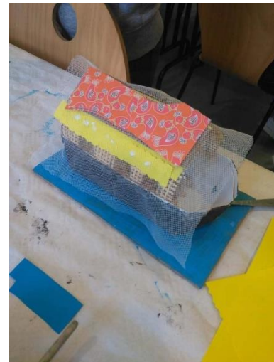
Samedi 16 octobre : atelier ludique avec l'Association Carton Plume (ci-dessus)